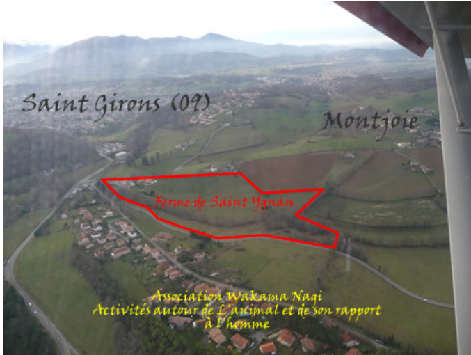
Lieu des rencontres d'ostéopathie, un cadre de calme et de verdure pour apprendre et échanger dans un beau pays moins pratique d'accès, mais plus convivial que les palace habituels !!! Et puis les animaux dont on parle sont là pour écouter !!! (photo prise d'ULM)

riences et votre point de vue avec nous.